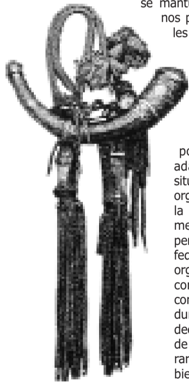
Cuerno de pólvora

Mientras Melilla dispuso del campo exterior, con una línea de fuertes avanzados, los rifeños se mantuvieron en sus cercanos poblados como cuarteles permanentes; pero en el momento en que se perdieron los fuertes exteriores a fines del XVII y los kabileños tuvieron que avanzar sus trincheras, lejos de los poblados, hubo que adaptarse a la nueva situación, creándose una organización distinta en la que estaban comprometidas todas las kabilas pertenecientes a la confederación. Este tipo de organización y modo de combate se mantuvo, con apenas variaciones, durante siglo y medio; es decir, hasta que la plaza de Melilla volvió a recuperar el terreno perdido ya bien avanzado el XIX, anhelo, por otra parte, de todos los gobernadores de la plaza durante el periodo indicado, como medio de impedir la presión, en ocasiones angustiosa, del enemigo tradicional.