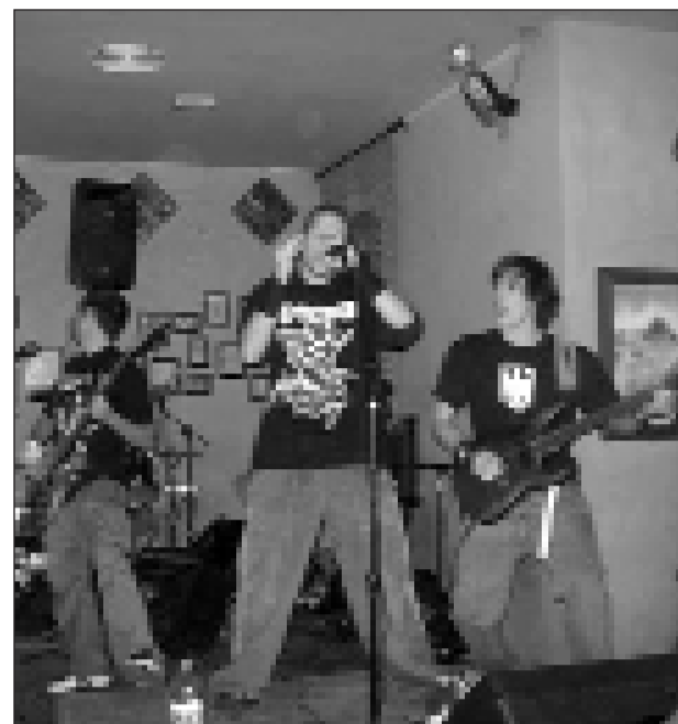
El grupo fue bien acogido durante su debut en el pub Tucán

“La cualidad que verdaderamente predomina en el grupo es que somos amigos. Es decir, la amistad es un lazo que une perfectamente nuestro hobby, que es la música, con las personas”.