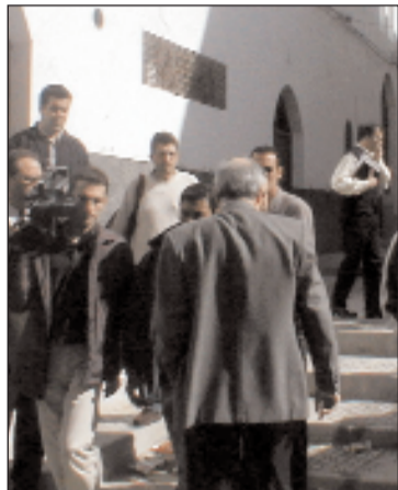
Es habitual obras en las cercanías de la Cañada en campaña

En política no siempre es posible distinguir la alucinación de la realidad. He leído hasta siete veces esta noticia intentando encontrar un sentido distinto al que inequívocamente se desprende de la literalidad de la afirmación de Juan José Imbroda y sólo obtengo la conclusión colateral de que, si nadie presenta objeciones a esta clase de propuestas surrealistas, pronto veremos colgado en farolas y comercios el retrato del presidente de la Ciudad Autónoma.