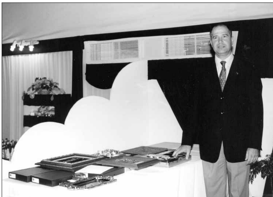
Rodeado de presentes en el homenaje que le organizó la APDM