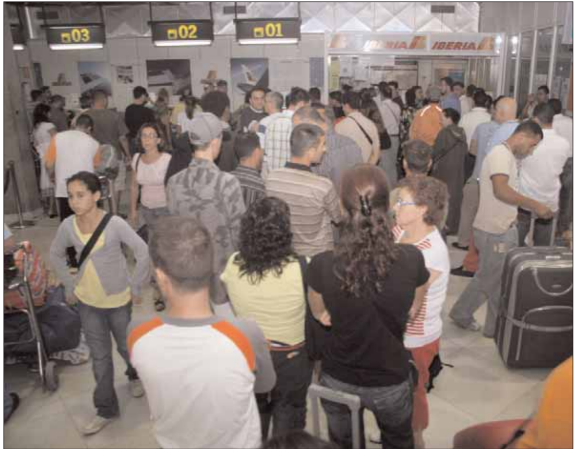
Tanto en el puerto como en el aeropuerto en la segunda quincena de agosto se produjeron grandes colas de espera para poder viajar hacia la Península. Muchas protestas del pasaje, muchas.