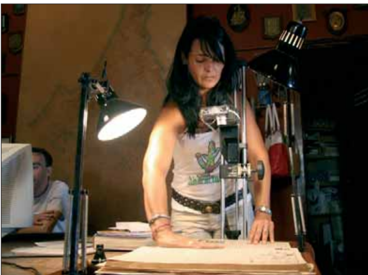
Digitalización de los periódicos melillenses por el Centro de Estudios sobre el Espacio Público y la Asociación de Estudios Melillenses a través de los planes de empleo de la UPD