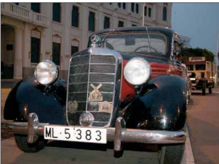
"Melilla y el automóvil en el siglo XX", un libro realizado por varios melillenses que contó con una exposición viva de coches antiguos