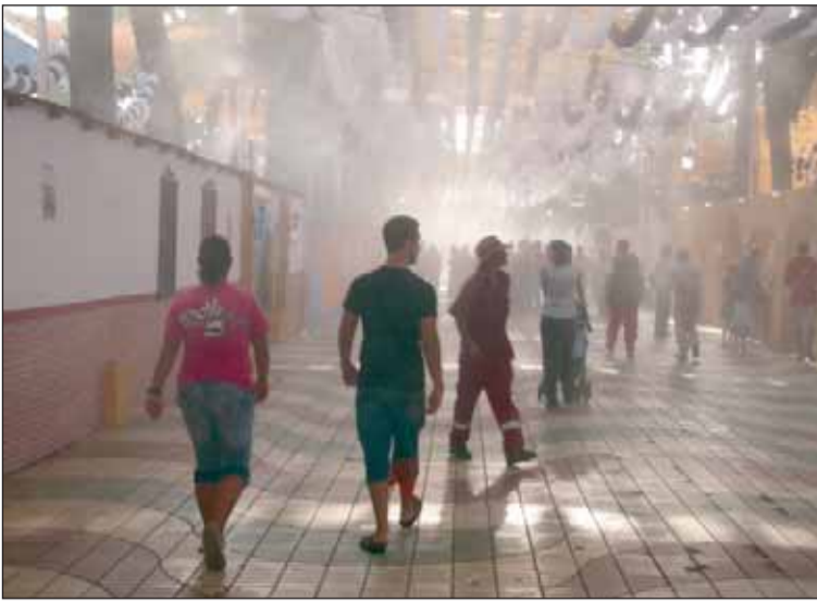
El microclima instalado en el paseo central del Parque Hernández (12.000 €) uno de los aciertos de la pasada feria