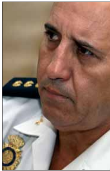
Florentino Villabona anunció su dimisión como jefe policial