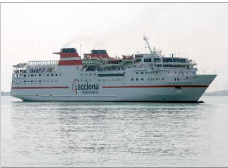
Las quejas de los usuarios del transporte marítimo se extendieron al buque Santa Cruz de Tenerife