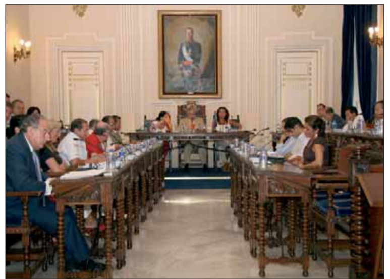
Y volvió la actividad al plenario de la Asamblea, quizás en un ambiente más sosegado que antes del verano