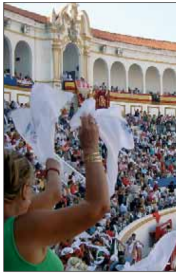
La corrida de feria contó con el beneplácito del público