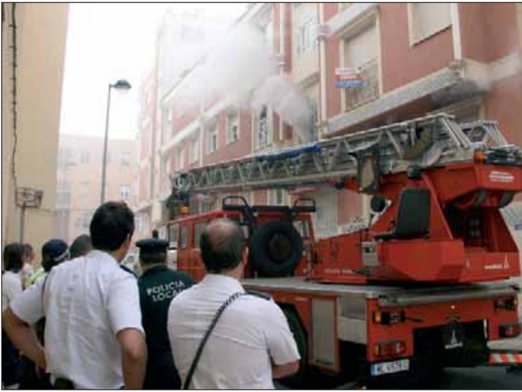
Incendio en el barrio del Hipódromo, sin víctimas pero con rescate de una mujer, un perro y varios pájaros en sus jaulas