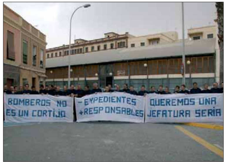
En este mes se iniciaron las protestas de los bomberos y la apertura de un expediente sancionador. Tema pendiente.