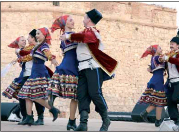
Pintoresco y atractivo espectáculo el ofrecido por el Ballet Folklórico Nacional de Rusia en la Plaza de las Culturas