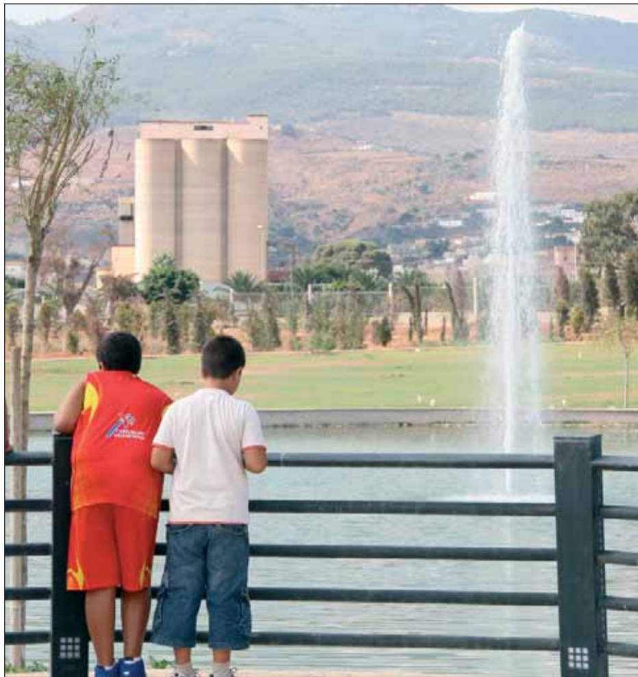
Los melillenses comenzaron a disfrutar del parque de "La Granja"