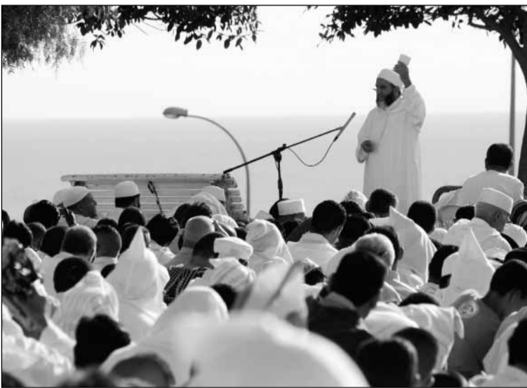
El 13 de octubre miles de musulmanes celebraron el "Aid El Fitr" en el campo de deportes de Cabrerizas Altas