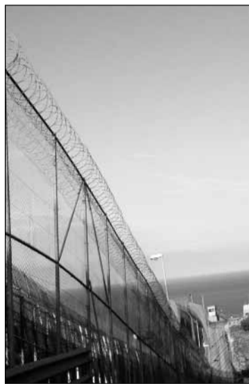
Interior anunció la retirada total de la sirga de las vallas