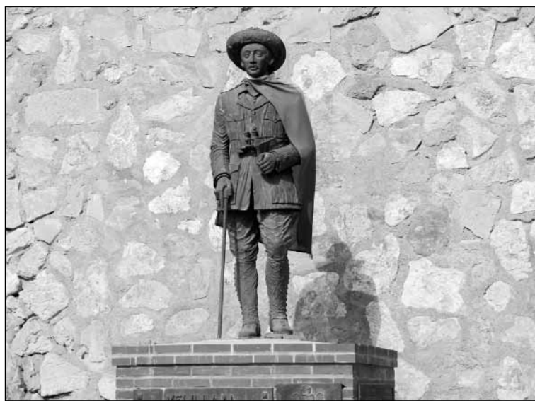
La Ley de la Memoria Histórica está en trámite de ser aprobada y COFRISA pregunta qué pasará con la estatua de Franco