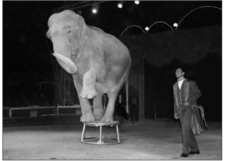
Los más pequeños disfrutaron del Circo Martini, ubicado en la Explanada de San Lorenzo, en la primera quincena del mes