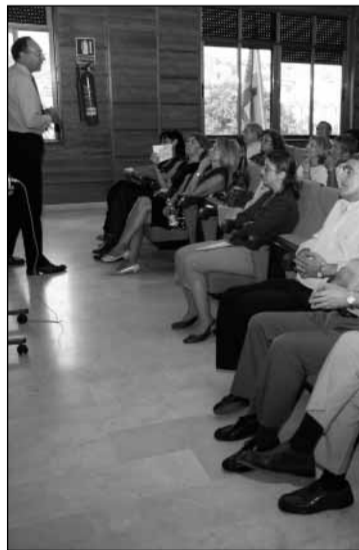
Comenzó un nuevo curso de la Universidad de Mayores