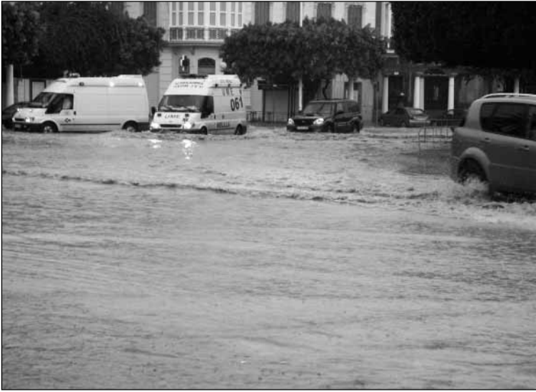
El 28 de octubre cayeron cerca de cien litros por metro cuadrado y volvieron a inundarse las calles céntricas de la ciudad