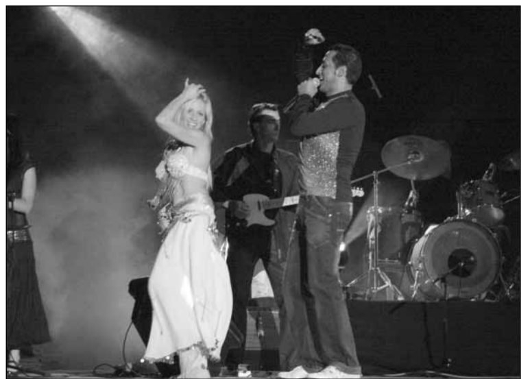
El cantante Karim dió un concierto como parte de las actividades del final de mes de Ramadán