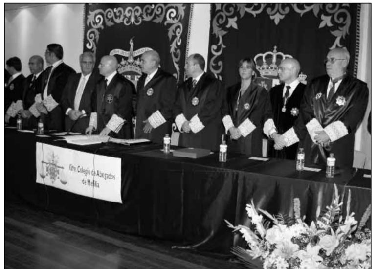
El Colegio de Abogados celebró el 75 aniversario de su fundación con la asistencia del Defensor del Pueblo, Enrique Múgica