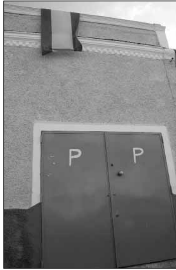
El día de la Fiesta Nacional ondearon banderas