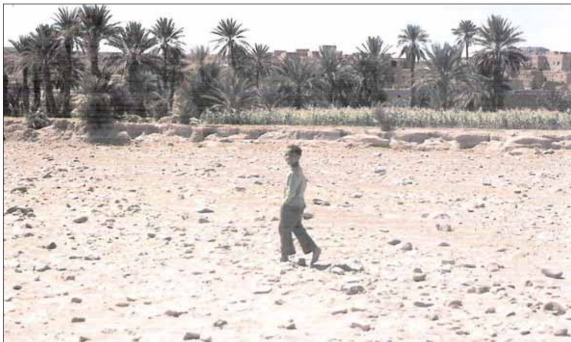
Niño en Ait Saadan